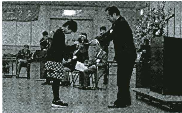
▲成績優秀者・団体表彰

マラソンのエピソードなどを交えながら、ランニングプロデューサーの仕事を通じて地域貢献の大切さなどをお話頂きました。講演終了後の質問にもわかりやすく答えて頂きました。